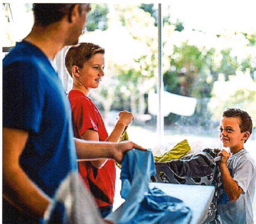
La suddivisione dei lavori domestici inizia sin dalla prima infanzia. In questo modo, i bambini diventano responsabili e svolgono il proprio ruolo con autorevolezza.

... Possono aiutare a riordinare le posate nei cassetti. Se i genitori gli preparano i vestiti, vestirsi e svestirsi da soli. Infine, possono cambiare il rotolo della carta igienica quando è finito.